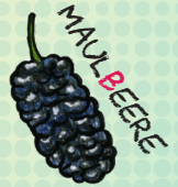
MA L BEERE