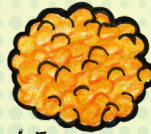
L I NSEN