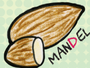
MA N DEL