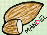
MA N DEL