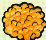
LIN S EN