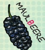
MA UL BEERE