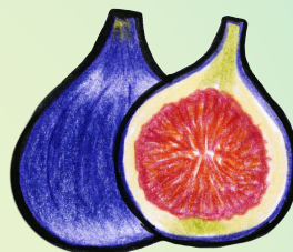
FEI G E