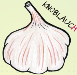
KN O BLAUCH