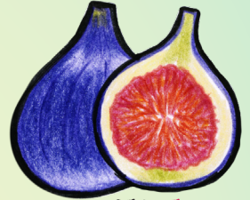
FEI G E